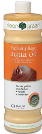
aqua oil® Intensivpflege

Zur Auffrischung/Renovierung von strapaziertem, geöltem, sehr dunklem Parkett empfehlen wir aqua oil black. Für weiß geöltes Parkett empfehlen wir aqua oil white.