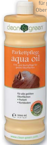
Parkettpflege aqua oil